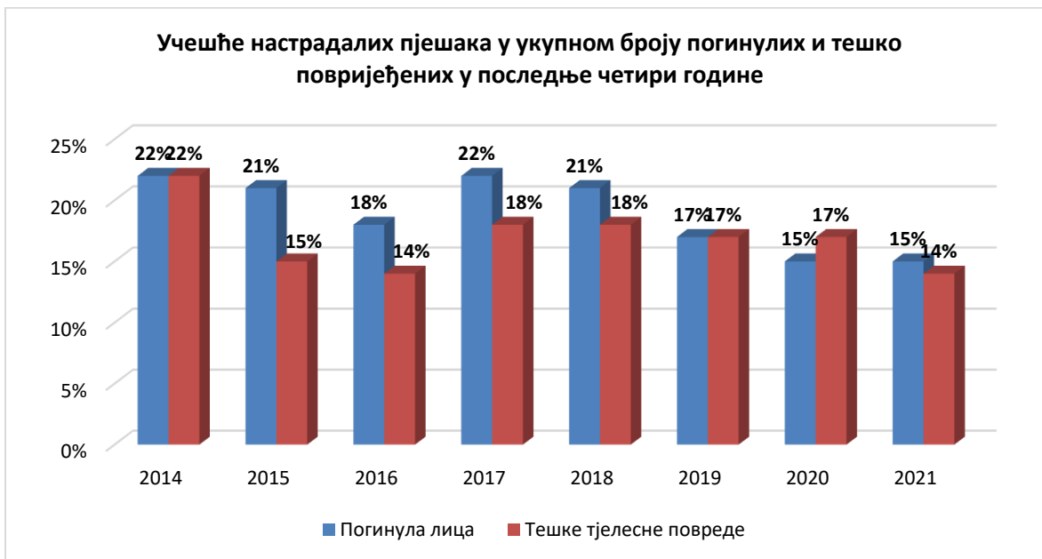
Дијаграм бр. 2. Приказ броја погинулих и тешко повријеђених лица у процентима

На дијаграму бр. 2. дат је приказ процента погинулих и тешко повријеђених лица (пјешака) од укупног процента погинулих и тешко повријеђених лица. Може се закључити да се учешће погинулих смањило за 3%, а проценат тешко повријеђених лица остао једнак у 2020. години у односу на претходну годину.