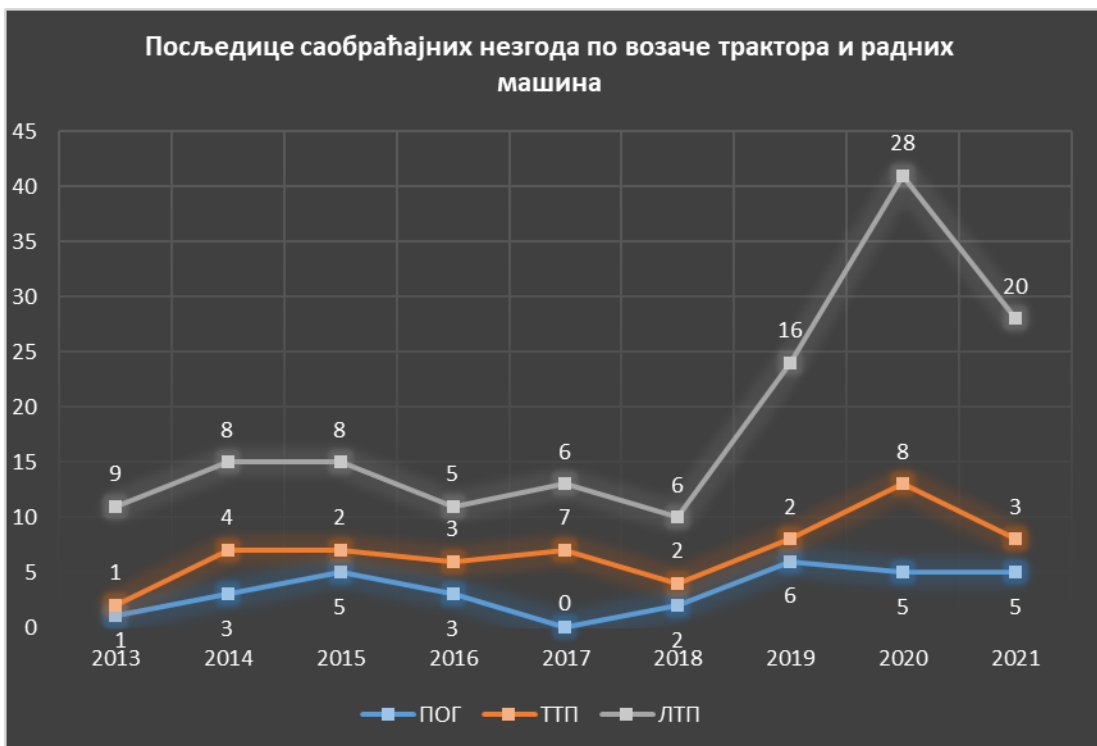
Дијаграм бр. 2. Посљедице саобраћајних незгода по возаче трактора и радних машина

радити на томе да се повећа безбједност возача трактора и радних машина, нарочито кад је ријеч о погинулим лицима. Поред тога возачи трактора и радних машина утичу на безбједност осталих учесника у саобраћају јер својим непрописним понашањем повећавају ризик од настанка саобраћајне незгоде у којој може бити повријеђено друго лице. Због разлике у брзинама између моторних возила и трактора освјетљење је веома битно како у дневним тако и у ноћним условима, стога је Законом о основама безбједности саобраћаја прописано да приликом кретања на трактору мора бити упаљено жуто ротационо свијетло (члан 90.). Како едукативним тако и репресивним мјерама се треба обезбједити поштовање ове законске одредбе, а у циљу повећања безбједности свих учесника у саобраћају.