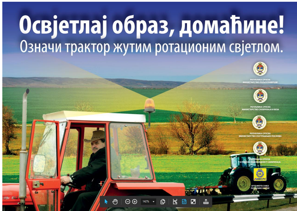
„Прва страна летка“