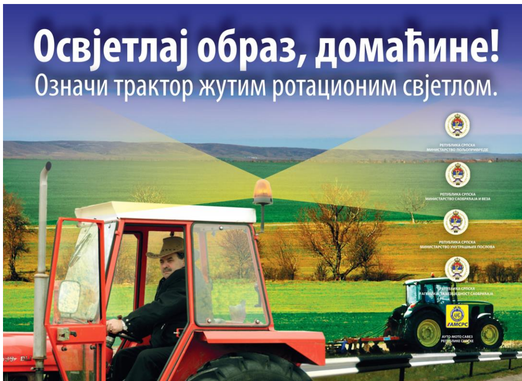
„Прва страна летка“