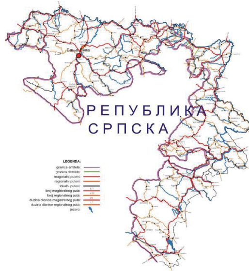
Слика 1. Магистрални и регионални путеви у Републици Српској (сајт ЈП „Путеви РС“)

На територији Републике Српске путну мрежу чини 32,3 km аутопутева, 1.781 km магистралних путева, 2.183 km регионалних путева, 227 km локалних путева који су посебном одлуком Владе Републике Српске проглашени битним за функционисање укупног саобраћаја на територији Републике Српске као и остали локални пuetви и улице у насељу локалних заједница 3 .