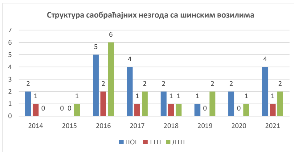
Дијаграм бр. 1. Структура саобраћајних незгода у жељезничком саобраћају

На дијаграму бр. 1. може се видјети структура саобраћајних незгода у жељезничком саобраћају у периоду од 2014. до 2020. Године, док су посљедице тих саобраћајних незгода знатно веће јер у једној саобраћајној незгоди може бити већи број повријеђених људи.